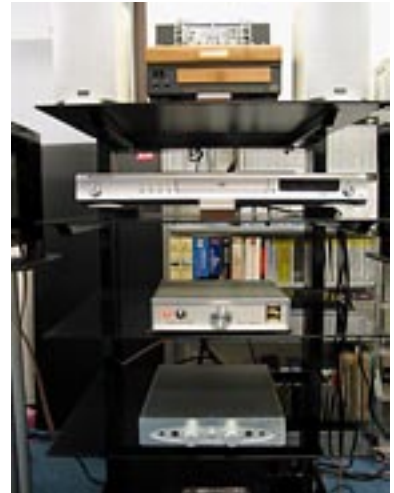
同店が推奨する「10万円コンボ」の構成要員。オーディオプロのスピーカー“ALLROOM SAT”とサウンド・ウォーリアのCD付真空管プリメインアンプ“SW-C20B”（上写真最上段）を筆頭に、パイオニアのユニバーサルプレーヤー“DV-585A”（同2段目）、シャッツグレイバーのプリメインアンプ“DRA-MS1”（同3段目）、CECのヘッドフォンアンプ“HD53R”。そしてアナログプレーヤーとしてはBSRの“375改”（¥25,000）が待機している（左写真）