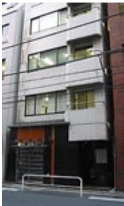
「Living Music」はオフィスビルの4F。予約制で美味しいコーヒーを飲みながら、ゆったりと音楽を楽しむことが出来る