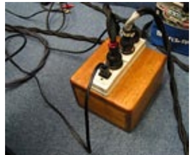
オーディオ FSK の電源ボックス "MG-1" も取り扱い中