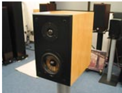
六本木工学研究所製のスピーカー試作機。この雑誌が発売される頃には「10万円コンポ」の中核を担う存在としてデビューしているはずだ