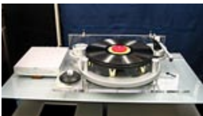
同店におけるメインシステム（右写真）。スピーカーにウィーンアコースティックの“T-3G”と“T-2G”。CDプレーヤーにCECの“TL51X”と“CD5300”、プリメインアンプにも同じくCECの“AMP71”と“AMP5300”という布陣。そしてアナログプレーヤーには英国ミッチェル・エンジニアリングの最高峰“GyroDec”（上写真）を使用。フォノイコライザーとしてCECの“PH53”を併用