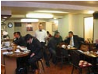
JR 神田駅北口にある「神田珈琲園」では毎月第4土曜日、18時～20時に「Living Music」主催のレコードコンサートが開催される

何やら出来立てホヤホヤのお店にしては「Living Music」、奥が深そうだ。 取材・文・写真 龍 悟(りゅう・せつ)(る)