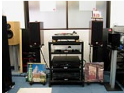
こちらは「25万円コンボ」の一群。プレーヤーにCECの“CD3300”、プリメインアンプに同じくCECの“AMP3300”、そしてスピーカーにウィーンアコースティックの“S-1G”が組み合わされている