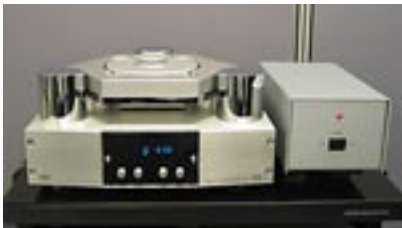
リファレンス的に使用されることも多い、CECの最高峰ベルトドライブトランスポート“TL0X”