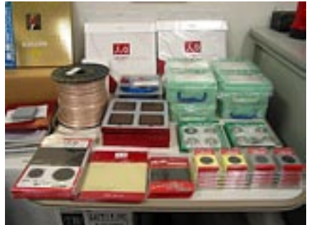
木曾興業の「フォック」、ナノテックシステムズ、サウンドアートなどのアクセサリも充実した品揃え